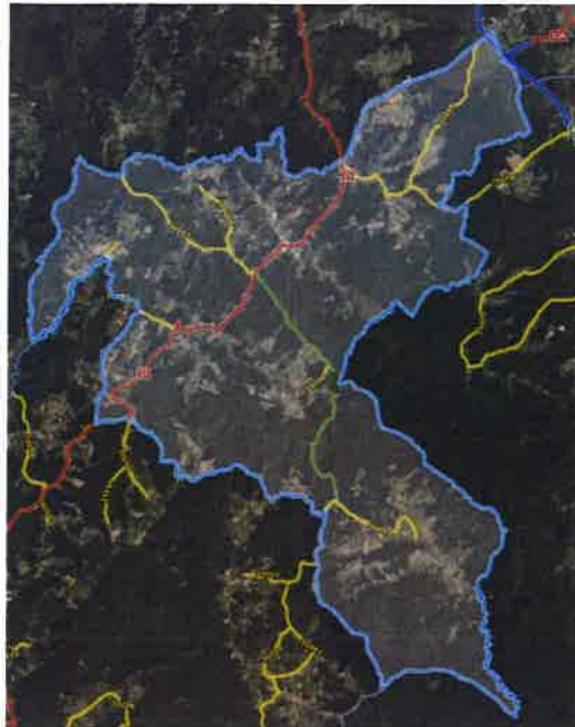
Slika 3. Državne, županijske i lokalne ceste na području Općine Kravarsko.

Općina Kravarsko je nadležna za održavanje nerazvrstanih cesta na svom području. Ukupna duljina nerazvrstanih cesta, sukladno Registru nerazvrstanih cesta na prostoru Općine iznosi 56.930 metra (Jedinstvena baza podataka o nerazvrstanim cestama na području Općine Kravarsko, Glasnik Zagrebačke županije 59/24).