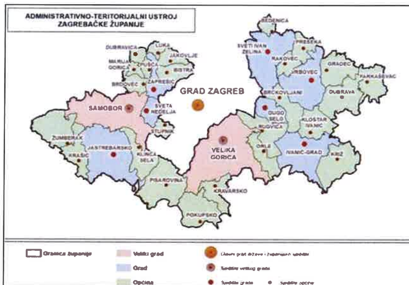
Slika 1. Položaj Općine Kravarsko unutar Zagrebačke županije. Izvor: Izvješće o stanju u prostoru Zagrebačke županije 2021. - 2024.; Zavod za prostorno uređenje zagrebačke županije; veljača 2025. godine