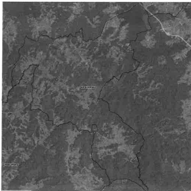
Slika 2. Područja ekološke mreže Natura 2000 na području Općine Kravarsko

Općina Kravarsko smještena je na južnim obroncima Vukomeričkih gorica i tipičan je primjer skladnog spoja niskog, valovitog brežuljkastog krajobraza i plodnih turopoljskih ravnica.