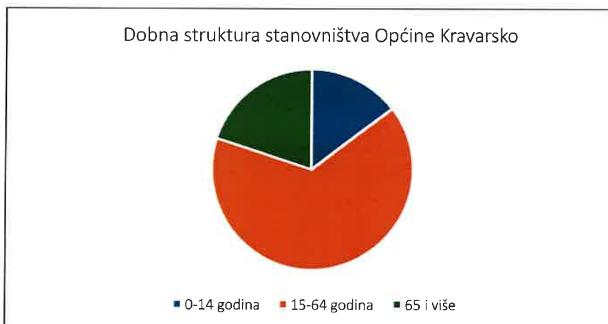
Graf 1. Dobna struktura stanovništva Općine Kravarsko.

Prema podacima Popisa stanovništva iz 2021. god., ukupan broj kućanstava na području Općine je iznosio 641.