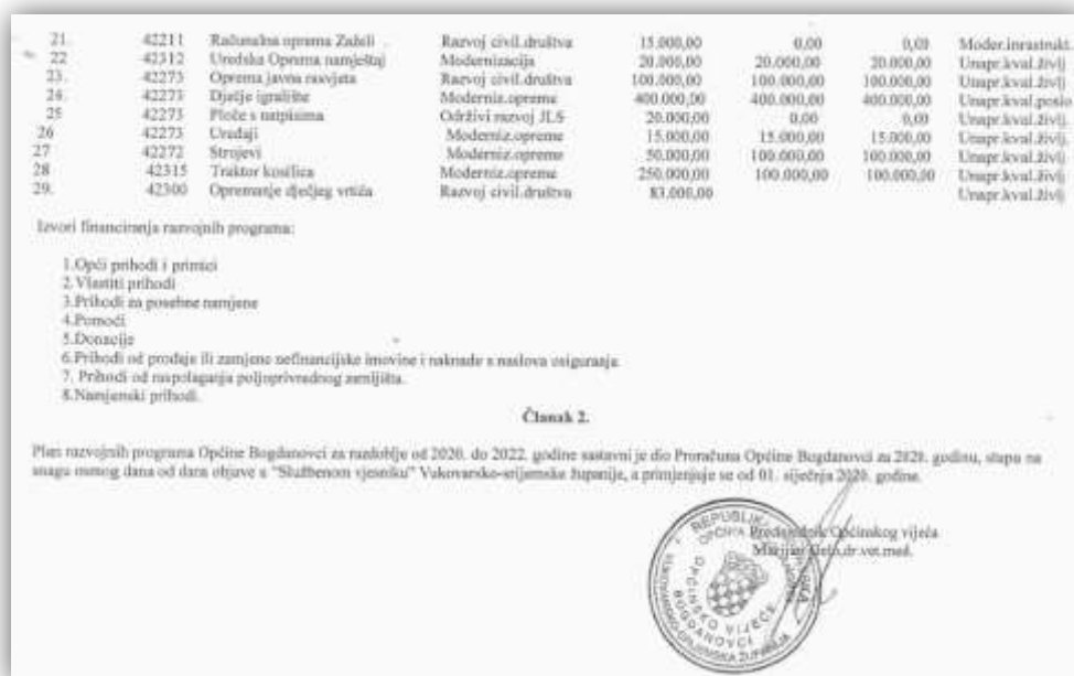
Slika 3. Plan razvojnih programa Općine Bogdanovci za razdoblje od 2020. do 2022. godine (redni broj 21-29)