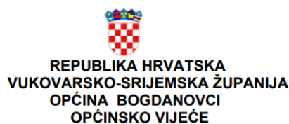
Slika 1. Plan razvojnih programa Općine Bogdanovci za razdoblje od 2022. do 2024. godine (str. 1)

KLASA: 400-08/-21-01/25 URBROJ: 2196-03/01/01-21-01 U Bogdanovcima, 15.12.2021.